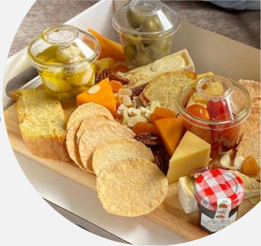
Tabla de quesos premium, para 12/15 personas, con variedad de quesos, frutos secos, verduras frescas, hummus, aceitunas y galletas de ajonjolí.